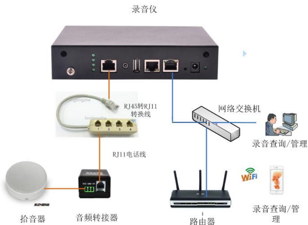
图 1 MDL4004 录音仪组网拓扑图

每台录音仪分配一个固定的 IP 地址，接入企业网络，就可以通过企业内任何一个电脑访问录音设备。直接通过 web 访问，无需另外软件。也可通过手机的 APP 访问。录音仪自带 WIFI 网络，手机可直接通过 WIFI 连接，无需另外的数据流量。